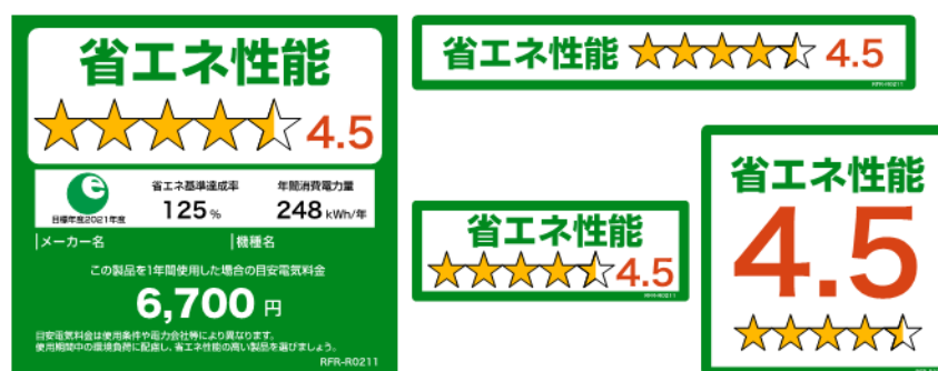
(冷蔵庫のイメージ)

※ 家庭用電気冷蔵庫、家庭用電気冷凍庫、照明器具及び電気便座については、2020年11月に上記様式に変更済。今後、家庭用エアコンディショナー、テレビジョン受信機、温水機器（ガス温水機器、石油温水機器、電気温水機器）についても上記様式に倣ったものに変更予定。